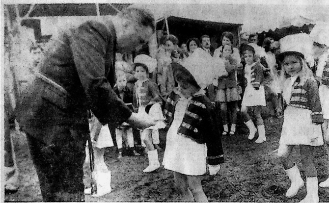
Elle le méritait bien, la petite Majoirette, de goûter le « Stivalien »...

Sois sage, Aime le fromage Vosgien Choisis le Stivalien